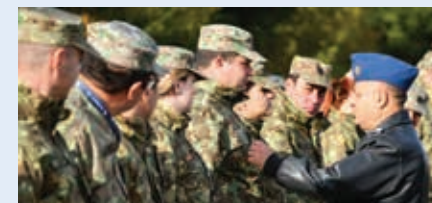
Loctiitorul comandantului Bazei 90 Transport Aerian, comandorul Ion David, a felicitat militarii

În data de 28.10.2024, la Baza 90 Transport Aerian, Otopeni, a avut loc ceremonia militară de avansare în grad și citire a ordinilor de numire în funcție a unor militari din baza aeriană, cărora le-au fost recunoscute meritele profesionale și loialitatea față