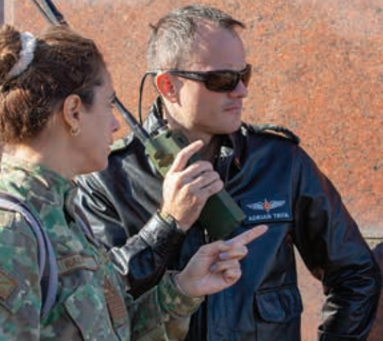
Zborul a fost supravegheat de o echipă mixtă formată din militari din Statul Major al Forțelor Aeriene, Baza 90 Transport Aerian și Centrul 85 Comunicații Aero și Informatică