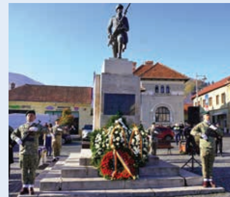
25 octombrie Academia Forțelor Aeriene „Henri Coandă”

Ordinul de zi nr. 392 bis din 29 octombrie 1944 al comandantului Armatei IV omagia astfel această victorie: „La chemarea țării pentru dezrobirea Ardealului, rupt prin Dictatul de la Viena, ați răspuns cu însuflețire și credință în izbânda dreptății poporului nostru. Tineri și bătrâni ați pornit spre hotarele sfinte ale patriei și cu piepturile voastre ați făcut zăgaz neînfricat dușmanului care vroia să ajungă la Carpați. Apoi, alături de marea Armată Sovietică, ați trecut la atac și după lupte grele de zi și noapte, fără răgaz, ați înfrânt dârza