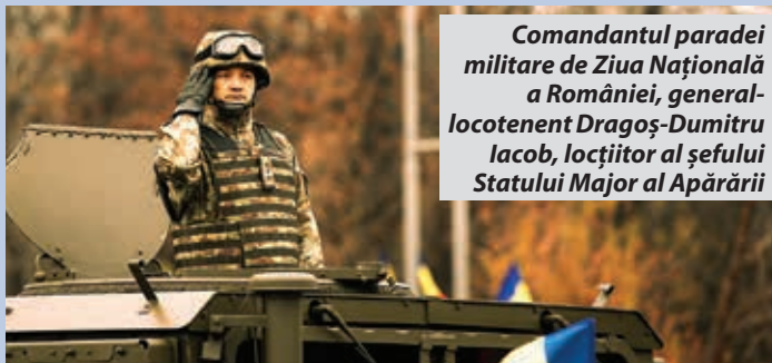
Comandantul paradei militare de Ziua Națională a României, general-locotenent Dragoș-Dumitru Iacob, loțiitor al șefului Statului Major al Apărării

Sistemul de rachete sol-aer PATRIOT defilând pe sub Arcul de Triumf