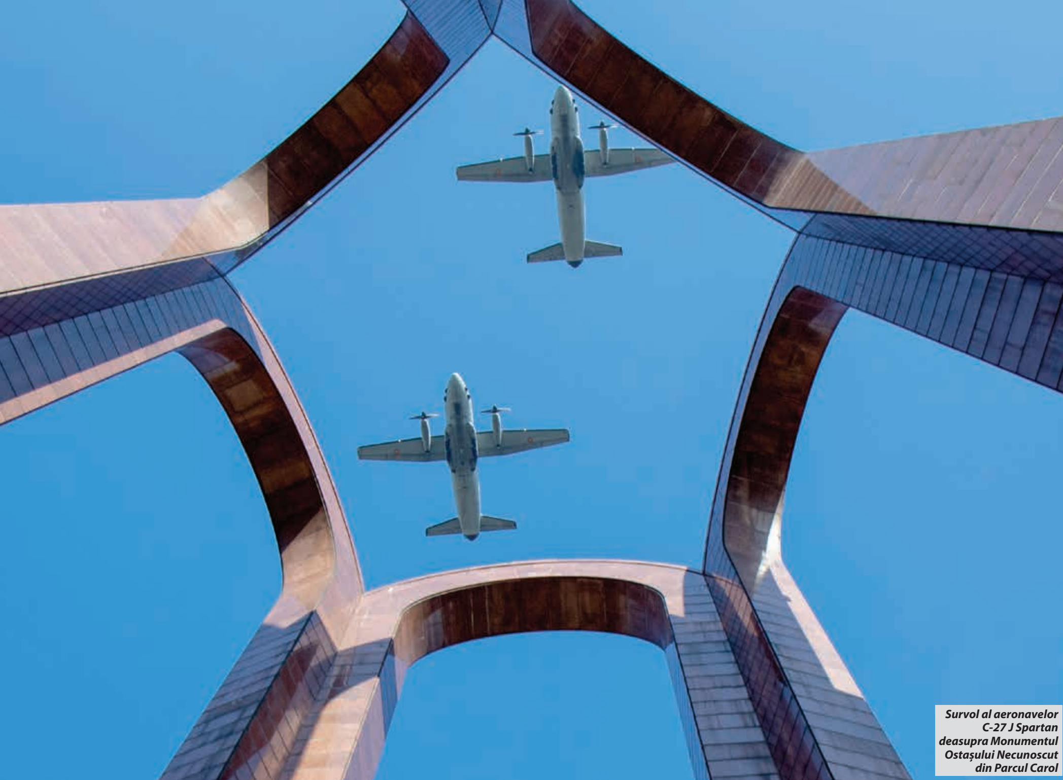
Survol al aeronavelor C-27 J Spartan deasupra Monumentul Ostaşului Necunoscut din Parcul Carol