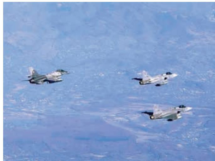
Piloții și echipele tehnice au participat activ la misiuni comune, simulând scenarii complexe ce implică detectarea, identificarea și interceptarea aeronavelor care încalcă regulile spațiului aerian NATO

În perioada 5-6 noiembrie 2024, Forțele Aeriene Române au participat la exercițiul bilateral româno-ungar „INTERCEPTOR 2024”, desfășurat în spațiul aerian al României și Ungariei. Activitatea a implicat două aeronave F-16 aparținând Bazei 86 Aeriană „Locotenent aviator Gheorghe Mociorniță” de la Borcea, demonstrând capacitatea operațională a aviației militare românești.