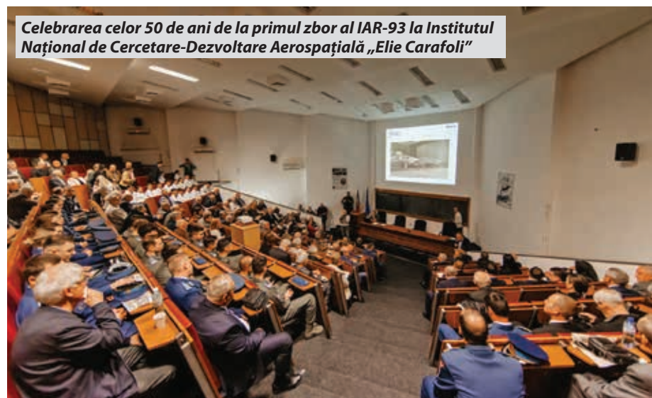
Celebrarea celor 50 de ani de la primul zbor al IAR-93 la Institutul Național de Cercetare-Dezvoltare Aerospațială „Elie Carafoli”

Text: Maria Ioniță