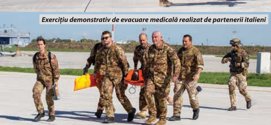
Exercițiu demonstrativ de evacuare medicală realizat de partenerii italieni