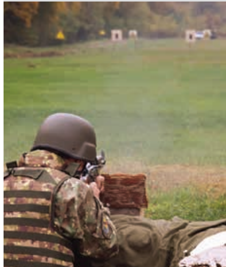
Zilele de concurs au fost încărcate cu probe ce au solicitat din plin concurenții