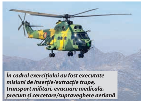
În cadrul exercițiului au fost executate misiuni de inserție/extracție trupe, transport militari, evacuare medicală, precum și cercetare/supraveghere aeriană