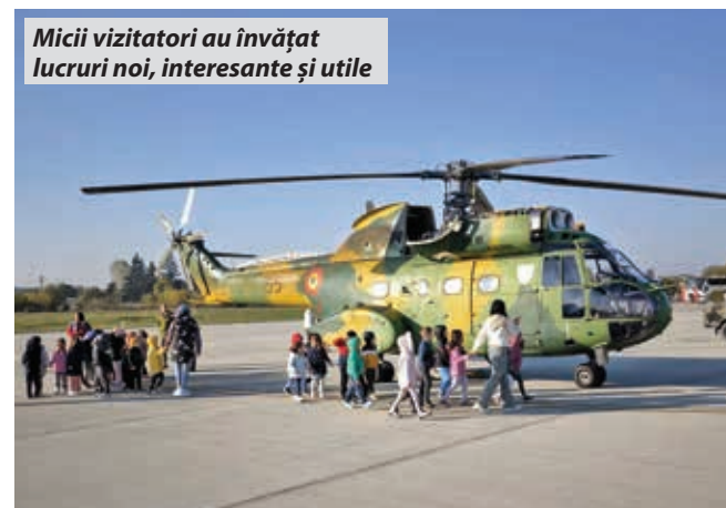
Micii vizitatori au învățat lucruri noi, interesante și utile