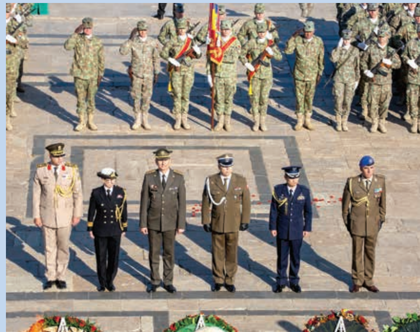
28 octombrie Baza 90 Transport Aerian