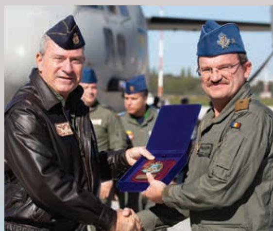
Finalul exercițiului a fost marcat de oferirea de simboluri din partea națiunii gazdă, ca apreciere a bunei colaborări în comunitatea operatorilor aeronavei C-27 J Spartan