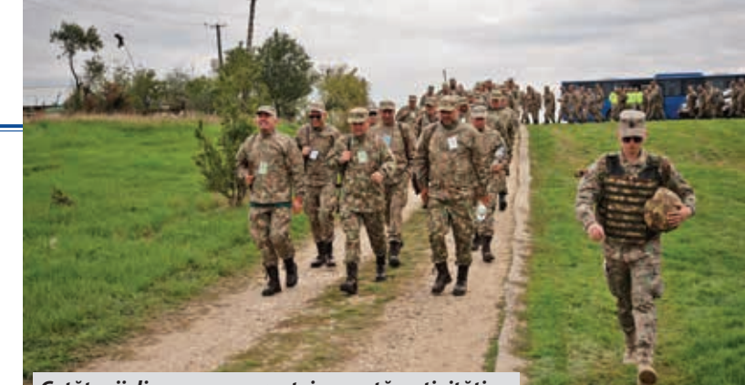
Cetățenii din rezerva armatei execută activități specifice de pregătire pentru a asigura protecția spațiului aerian românesc