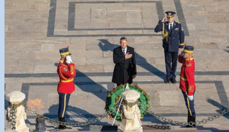
Preşedintele României, Klaus Iohannis, a depus o coroană de flori în semn de respect faţă de înaintaşi