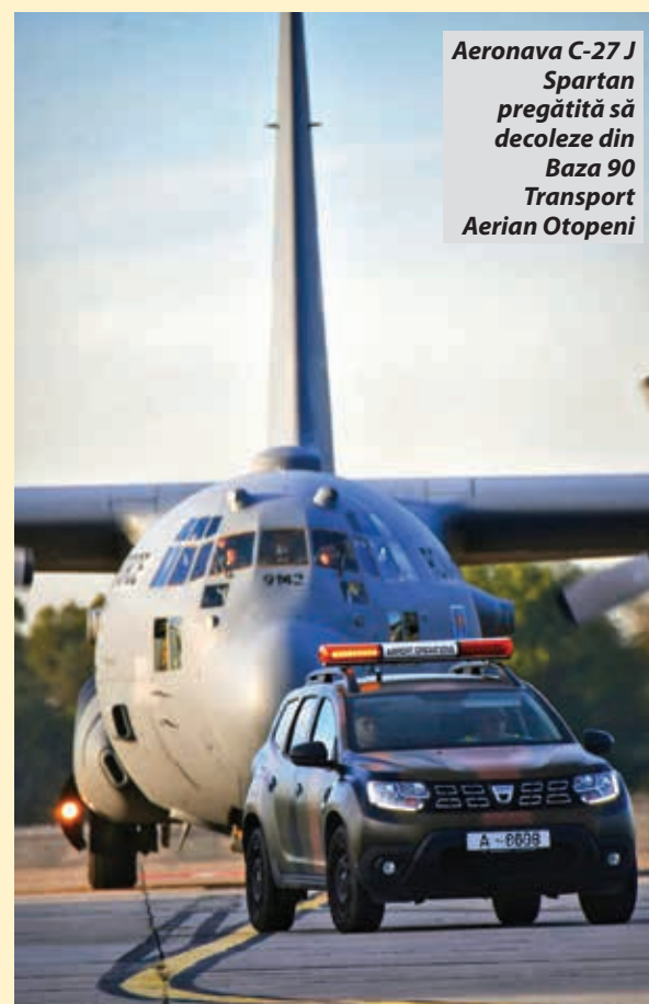
Aeronava C-27 J Spartan pregătită să decoleze din Baza 90 Transport Aerian Otopeni