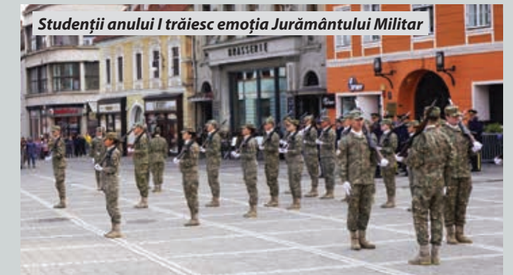
Piața Sfatului din Brașov a gazduit ceremonia Jurământului Militar al Academiei Forțelor Aeriene „Henri Coandă”