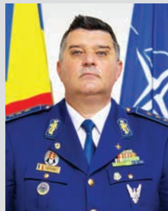
General-locotenent Leonard-Gabriel Baraboi Șeful Statului Major al Forțelor Aeriene

Finalul unui an de muncă, are pentru fiecare dintre noi o semnificație aparte. Este un moment de bilanț, când facem o analiză a anului care tocmai se încheie aruncându-ne, în același timp, o privire spre viitor.