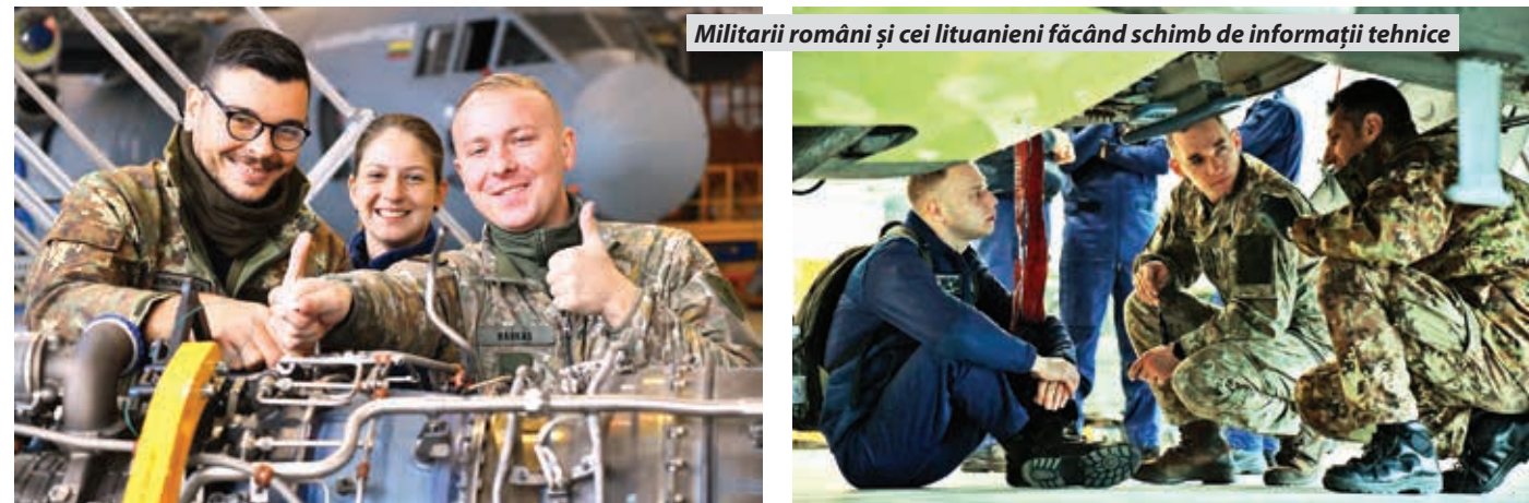
Militarii români și cei lituanieni făcând schimb de informații tehnice