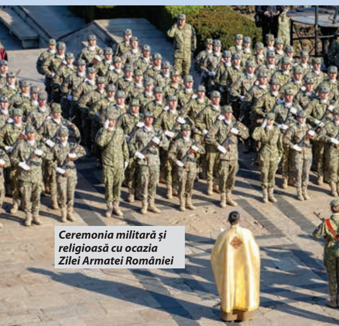
Ceremonia militară și religioasă cu ocazia Zilei Armatei României