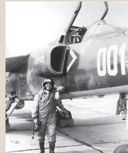
Colonelul Gheorghe Stănică, pilotul care a zburat prototipul în data de 31 octombrie 1974