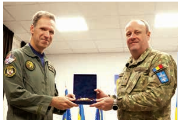
Comandantul Academiei Forțelor Aeriene „Henri Coandă” și comandantul detașamentului Forțelor Aeriene Spaniole