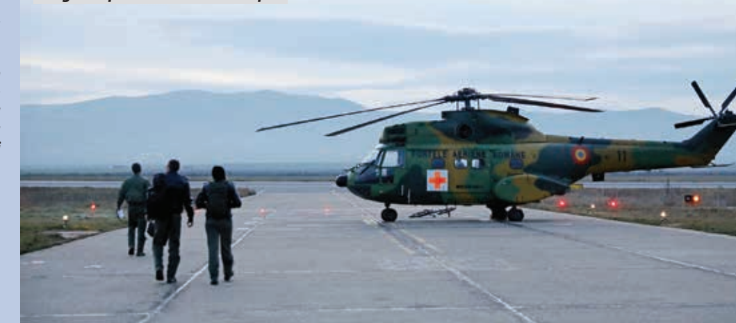
Pregătire pentru zborul de noapte

Interviu realizat de Ioana-Cristina Teișanu