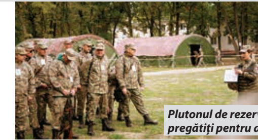
Plutonul de rezerviști, echipați și pregătiți pentru antrenamente