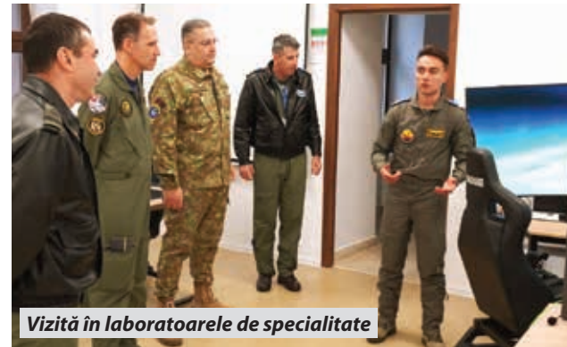
Vizită în laboratoarele de specialitate