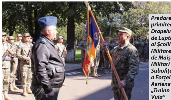
Predarea-primirea Drapelului de Luptă al Școlii Militare de Maiștri Militari și Subofițeri a Forțelor Aeriene „Traian Vuia”