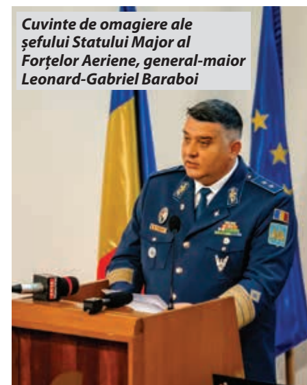
Cuvinte de omagiere ale șefului Statului Major al Forțelor Aeriene, general-maior Leonard-Gabriel Baraboi