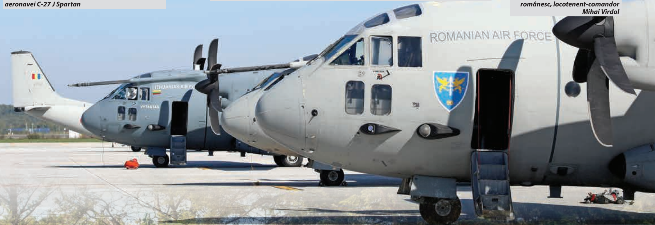
Detașamentele participante la exercițiu