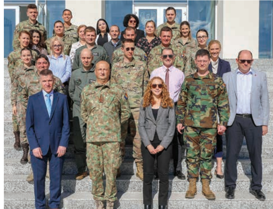
Exercițiul a oferit consilierilor juridici oportunitatea de a identifica și aplica legislația națională și internațională specifică dreptului operațional

În perioada 15-17 octombrie, la sediul Centrului 85 Comunicații Aero și Informatică, Secția Juridică din cadrul Statului Major al Forțelor Aeriene a organizat exercițiul „TTX LEGAD AirOps24”.