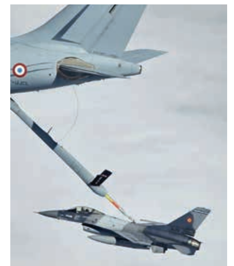
Realimentarea în aer, realizată de avioanele cisternă franceze, nu doar că a extins raza operațională a avioanelor F-16, dar a și oferit piloților români oportunitatea de a-și perfecționa tehnicile de realimentare în condiții de stres și coordonare internațională

Exercițiul NATO RAMSTEIN FLAG desfășurat în Grecia este un eveniment major de antrenament. Acest exercițiu face parte din eforturile NATO de a rafina și testa tacticile aeriene, în special în lumina dezvoltărilor și conflictelor geopolitice recente. Scopul său este de a îmbunătăți pregătirea și capacitățile forțelor NATO în apărarea aeriană și antirachetă, precum și în contracararea bruiajului electronic și a altor capacități de interdicție aeriană. Exercițiul se bazează pe manevre ofensive și defensive și pe integrarea diferitelor tipuri de aeronave pentru scenariul de antrenament cât mai realist.