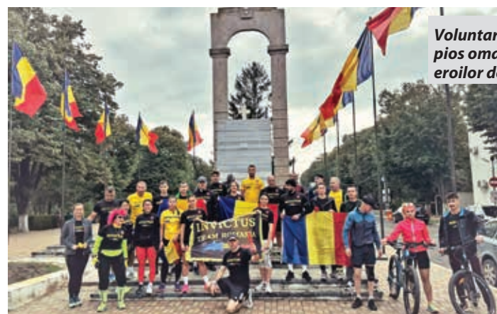
Voluntarii Invictus aduc prin sport un pios omagiu, cinstire și recunoștință eroilor de ieri și de astăzi

Momentul de maximă intensitate a avut loc în data de 25 octombrie, la Monumentul Ostașului Român din Carei, când cele trei ștafete s-au reunit, întregind astfel drapelul tricolor și prezentând onorul, în mod simbolic, tuturor celor care s-au jertfit pentru România. În drumul lor către Carei, voluntarii s-au oprit la monumentele ridicate în cinstea eroilor care și-au dat viața pentru România, omagiindu-i și reamintind sacrificiul făcut de străbunicii și bunicii noștri.