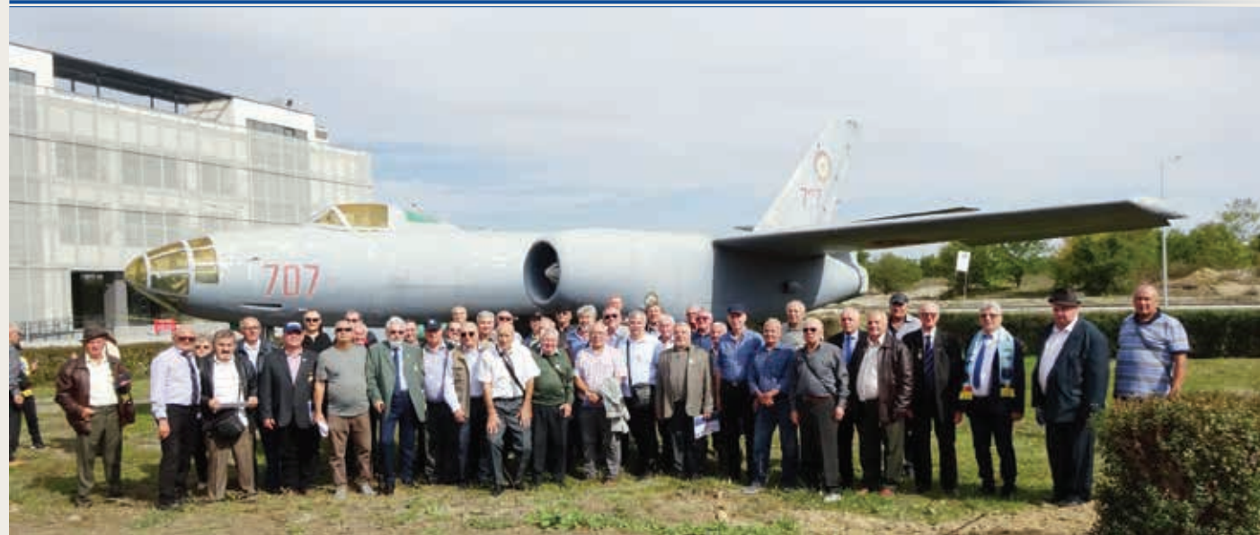
A.N.C.M.R.R. – Filiala locală „General aviator Ioan Zăpârțan” Fetești Revederea anuală a cadrelor militare care au activat pe aerodromul Borcea