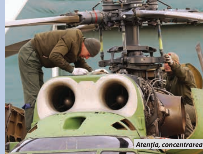
Atenția, concentrarea și munca în echipă sunt elemente esențiale pentru siguranța zborului

Fiecare dintre noi este important, dacă un membru al echipei nu își face treaba ca la carte, acest lucru va avea repercusiuni asupra misiunii în ansamblu. Este dacă vreți, principul domino-ului. Cum spuneam anterior, provocările sunt foarte mari, în special pentru primul care intră în luptă și poate avea repercusiuni sau efecte și pentru cei care urmează, dat fiind faptul că, ne-am propus să executăm mai multe rotații, astfel multiplicându-se câștigul experienței operaționale cu efecte benefice ulterior. În acest sens, consider că prima rotație are provocări nenumărate și am menționat mai devreme mediul de operare coroborat cu caracteristicile climatice care pot influența executarea misiunilor specifice vectorului aerian. În acest segment al instruirii, totuși, ne luăm măsuri specifice de armonizare a pregătirii, de standardizare a