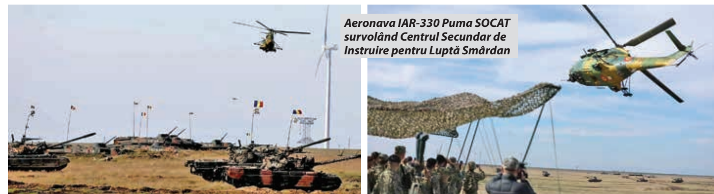
Aeronava IAR-330 Puma SOCAT survolând Centrul Secundar de Instruire pentru Luptă Smârdan